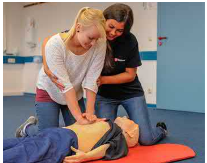
Auch die Reanimation wird im Erste-Hilfe-Kurs trainiert.