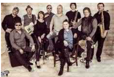
Soulmaxx - Samstag 6. Juli