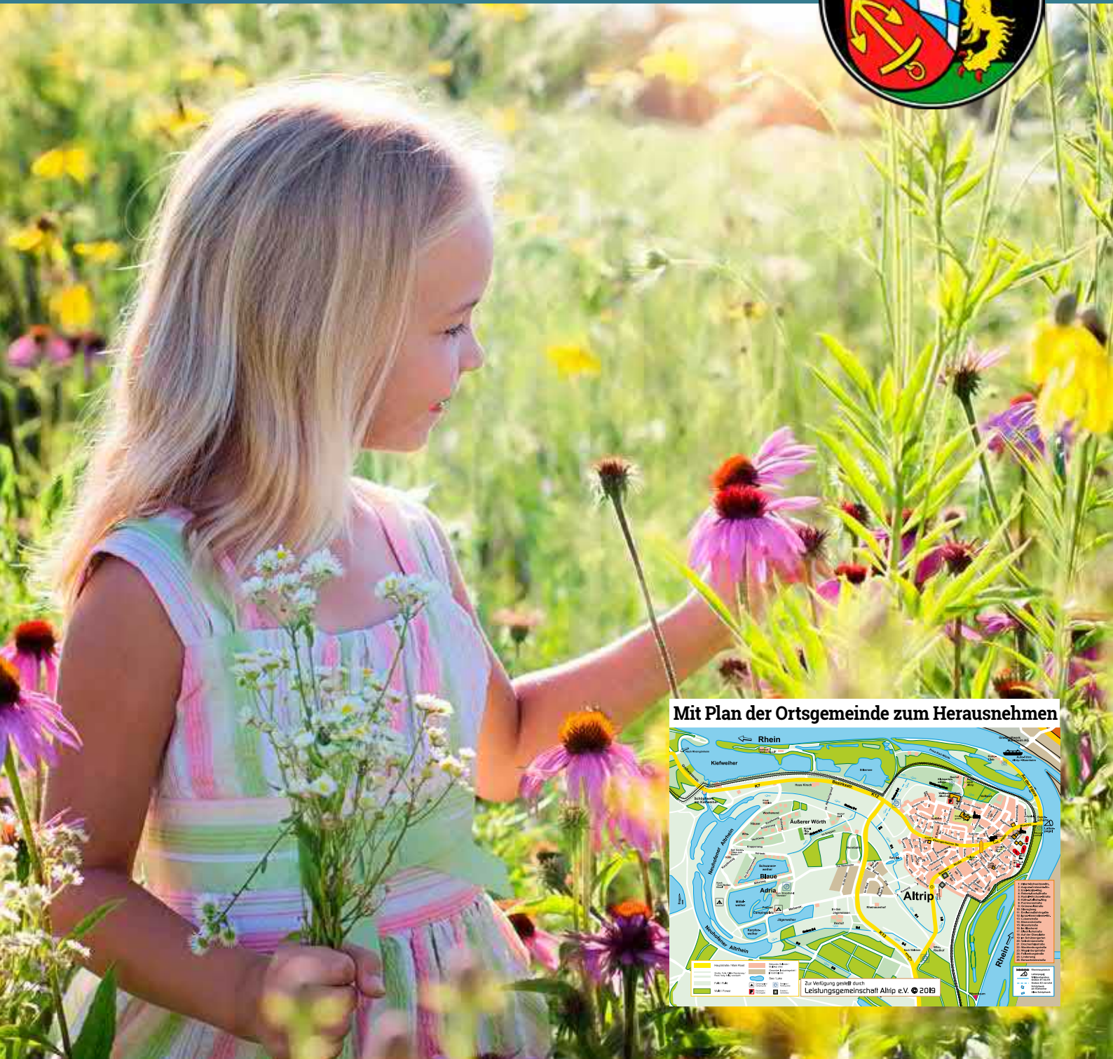
Mit Plan der Ortsgemeinde zum Herausnehmen