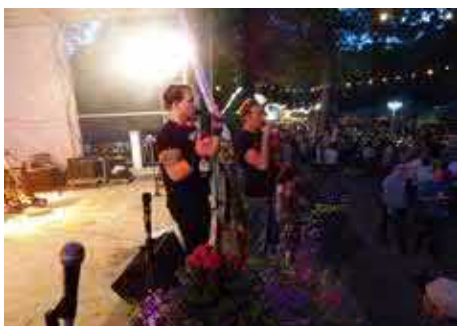
Grand Malör - Freitag 5. Juli