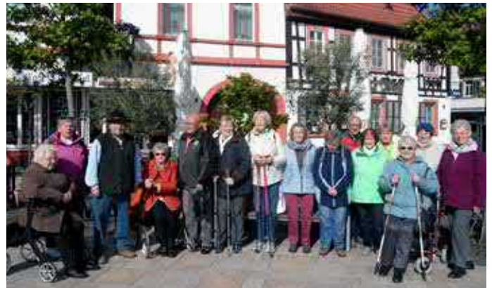
Text und Foto: Sonja Huck

Die Minis waren am Vormittag in Bad Bergzabern unterwegs. Zum Mittagessen waren sie in Birkenhördt beim „Häädstorze“ eingekehrt.