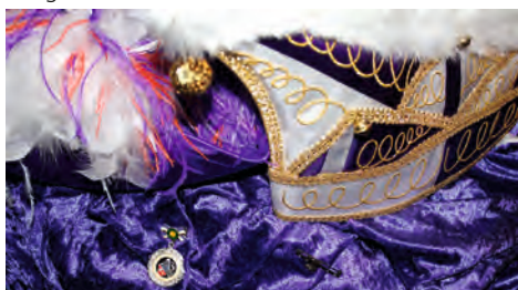
Gardehut, Narrenkappe & Auszeichnung

Sehr gerne sind zu diesem Tag auch alle interessierten Bürgerinnen und Bürger eingeladen – der Eintritt ist frei . Für die Augen gibt es viele Prinzessinnen in hübschen Gewändern von Nah und Fern und Auftritte aller unserer Tanzmariechen, Garden, unserer Schautanzgruppe und der Bauch-Beine-Po Tanzgruppe, die dieses Mal nicht erst zur Prunksitzung auf die Bühne möchten.