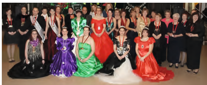
Ball der Prinzessinnen 2013

Wer Interesse an unserem 26.01.2019 stattfindenden „ Ball der Prinzessinnen “ hat: wir bitten um frühzeitige Bestellung der Karten. Die entsprechenden Möglichkeiten erfahren Sie auf unserer Homepage ( www.wasserhinkle.de ), auf unserer Facebook-Seite und hierin, „Altrip Aktuell“ in der nächsten Ausgabe. Dieser Ball findet immer nur zu besonderen Jubiläen statt – dieses Jahr zur Feier der „ 66. Prinzessin der KGW “. Dazu werden alle ehemaligen Tollitäten eingeladen und dürfen sich noch einmal wie eine Prinzessin fühlen. Zu diesem Anlass haben alle Interessierten die Möglichkeit, in Abendgarderobe zu Livemusik einen unvergesslichen Abend in feierlicher Atmosphäre zu verbringen.