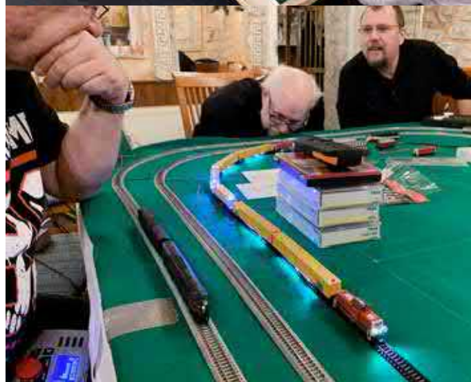
Der Tunnelrettungszug (TRZ) als Modell von Minitrix, umgebaut auf 30 digitale Schaltfunktionen und Sound. Der TRZ war so viele Jahre in Mannheim Hbf stationiert. Bis jetzt ist dieser Zug ein Prototyp.