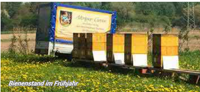
Bienenstand im Frühjahr