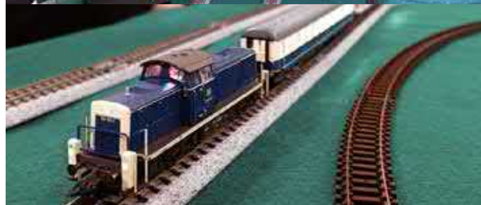
Minitrix BR 290 zeigt einen perfekten „Kupplungswalzer“. In dieser Ausführung gibt es das Modell in 1:160 zur Zeit 10 Mal weltweit.