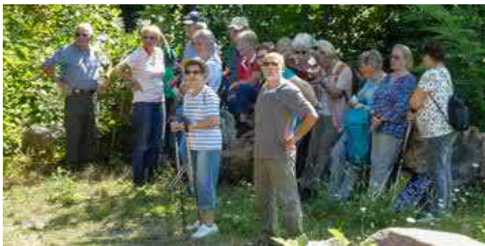
Text und Fotos: Sonja Huck