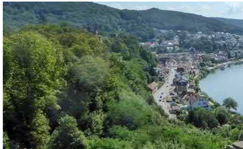
Blick von der Burgruine Hinterburg.