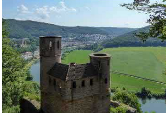
Blick auf die Ruine Schwalbennest.

Gemeinsames Mittagessen zusammen mit den Minis (die vormittags in Hirschhorn unterwegs waren) ist in Neckarsteinach im „Hotel Schiff“. Anschließend hatten wir Zeit zur freien Verfügung bis zur Heimfahrt um 17.00 Uhr. Einige waren nochmals als Wanderer unterwegs, die anderen verweilten in Neckarsteinach.