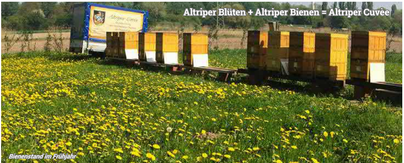
Bienenstand im Frühjahr