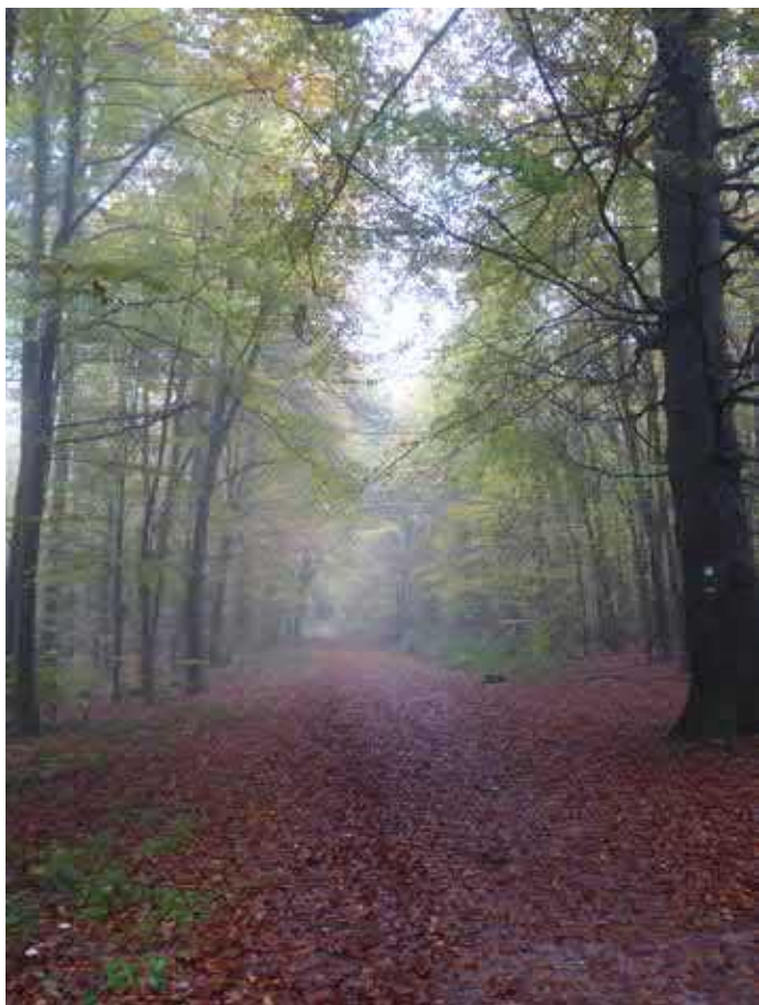
Text und Foto: Sonja Huck

Unsere vorletzte Wanderung in 2019 führte uns zum Felswanderweg nach Rodalben. Auf dieser Wanderung waren wunderschöne Felsformationen zu sehen, wie Fuchsfelsen, Klausfelsen und Eisenbörnchen um nur einige zu nennen. Es waren mehrere Auf- und Abstiege zu bewältigen. Zum Mittag kehrten die Wanderer im Hilschberghaus ein. Die große Tour wurde geführt von Wolfgang Gandert und Adalbert Huck und die kleine führten Doris Gandert und Sonja Huck. Unsere Minis waren am Vormittag in Pirmasens unterwegs. Zum gemütlichen Abschluß haben wir uns alle in Rodalben im Pfälzer Hof wieder getroffen.